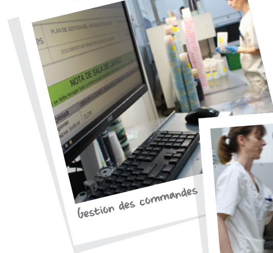
gestion des commandes

Dévolution: Il est recommandé de demander le service à l'avance pour qu'ecoverre puisse gérer la dévolution..